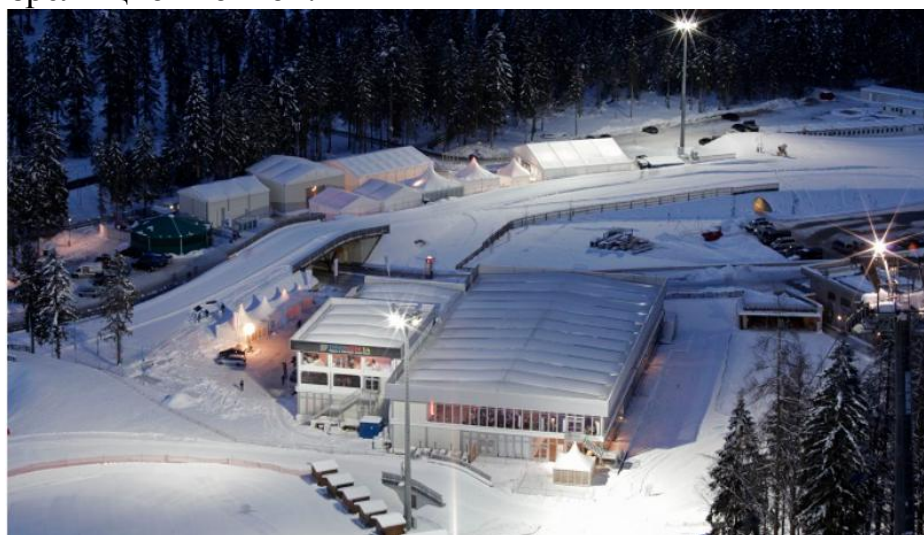
Рисунок 2 – 5-й этап Кубка мира по биатлону 2013 года в Рупольдинге на Chiemgau Arena

Для комфортабельного размещения особых гостей соревнований 5-го этапа Кубка мира по биатлону, Chiemgau Arena потребовалась VIP-зона. Помещение должно было обеспечивать наилучший обзор гонки. В условиях горного ландшафта и при стабильно отрицательных температурах организовать комфортные условия и прекрасный вид можно только с помощью специальных тентовых конструкций. Уникальный двухэтажный павильон с фасадом из стекла и прозрачного ПВХ позволил гостям мероприятия в тепле и комфорте наслаждаться зрелищной гонкой.