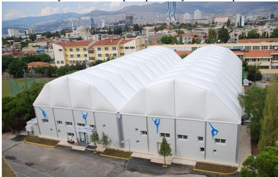
Рисунок 3 – Уникальный гимнастический зал для долгосрочного использования в Турции (Измир)

Уникальный гимнастический зал для долгосрочного использования в Турции (Измир). Этот необычный гимнастический зал был построен по инициативе Управления по делам молодежи и спорта Измира для подготовки спортсменов к Олимпийским играм 2016/2020 годов. Оптимальным решением стала конструкция с надувной крышей и стенами из сэндвич-панелей, оснащенная всеми необходимыми инженерными системами, которая позволила обеспечить оптимальные условия для тренировок лучших спортсменов страны.