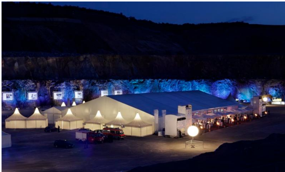
Рисунок 7 – Юбилей компании Schaefer Kalk

так, чтобы каждый из гостей чувствовал себя в необычных условиях, буквально на дне карьера, комфортно и свободно. Для реализации столь масштабного и сложного объекта были использованы 32 тентовые конструкции. Для подготовки всех шатров и павильонов к приему гостей потребовалось всего 6 дней.