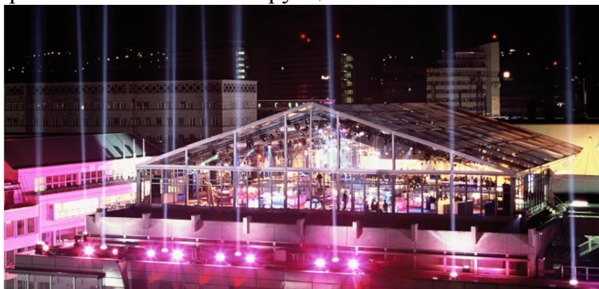
Рисунок 5 – Презентация автомобиля Smart ForTwo на крыше ТЦ в Штутгарде (Германия)

Проект был удостоен премии IAA Award в номинации «Лучший коммерческий проект в тентовых конструкциях».