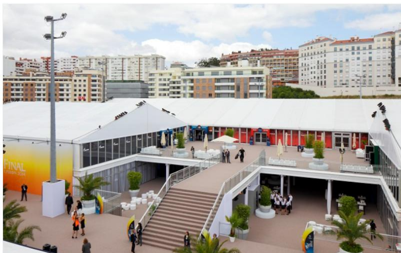
Рисунок 1 – Финал Лиги Чемпионов 2014 в Лиссабоне на стадионе The Estádio do Sport Lisboa e Benfica

Организация Финала Лиги Чемпионов 2014 года в Лиссабоне на стадионе The Estádio do Sport Lisboa e Benfica потребовала от организаторов практически невозможного — в сжатые сроки в условиях ограниченного пространства возвести вокруг стадиона все требуемые УЕФА объекты временной инфраструктуры. Ситуацию осложняли узкие подъездные пути. Создание полноценной временной инфраструктуры для проведения Финала Лиги Чемпионов потребовало всего 5 недель.