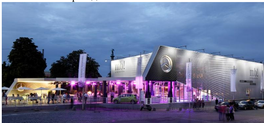
Рисунок 4 – 125-й День рождения автомобиля Мерседес-Бенц

создала концепт гигантского двухэтажного павильона в серебристо-серых тонах. Превратить павильон в кубическое строение помогла уникальная система крепления тентовых фасадов.